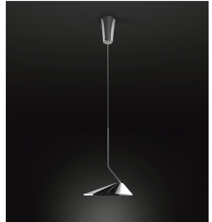
Image does not show north American canopy. La fotografía no muestra el florón de Norteamérica.