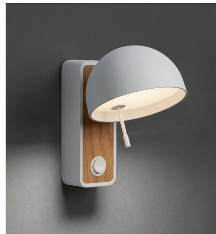
Image does not show north American back plate. La fotografía no muestra la placa de fijación.